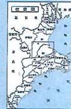
松阪処理区管内流量観測施設一覧