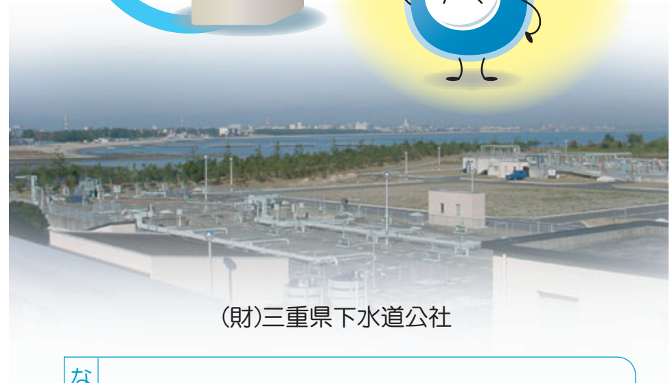
(財)三重県下水道公社